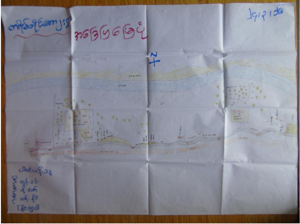
အရင်းမြစ်ပြမြေပုံ

ကျန်းမာရေးအနေဖြင့် နာမကျန်းဖြစ်ပါက အမှတ်(၁၈)ကုတင်(၁၀၀)ဆံ့ တပ်မတော်ဆေးရုံတည်ရှိပါသည်။ သောက်သုံးရေအနေဖြင့် ရွာရေတွင်းနှင့် အဝီစိတွင်းများမှ ရရှိနိုင်ပြီး နွေရာသီတွင် သုံးစွဲရန် အခက်အခဲ ရှိပါသည်။ ကရိုက်တိုင်ကျေးရွာတွင် ဥယျာဉ်ခြံနည်းငယ်ရှိပြီး သစ်တောအနည်းငယ်ရှိပါသည်။